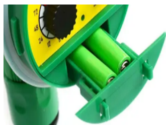
Отсек для батареек