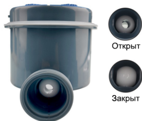
Шаровый запорный механизм